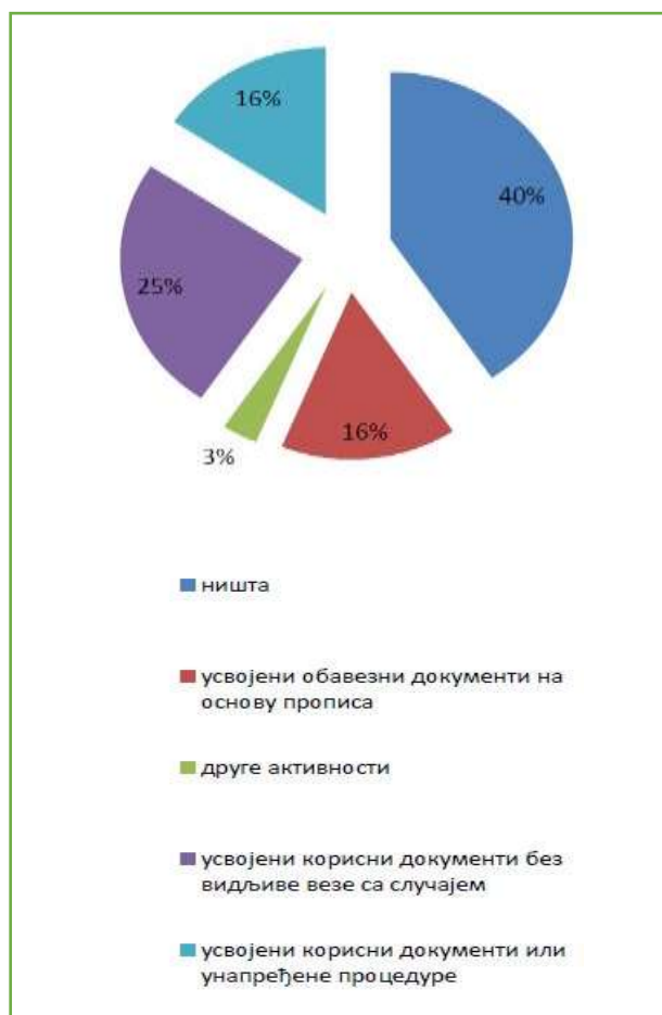
Графикон број 1: врсте активности које су спроведене као реакција на коруптивни догађај

Када се достављени подаци о спроведеним активностима анализирају, упореде са конкретним коруптивним догађајима и временом када се догађај десио, када је откривен и када су евентуални документи и/или процедуре донете, добијају се следећи подаци о превентивним активностима посматраних органа спроведеним након коруптивног догађаја, а како би се спречило његово понављање: