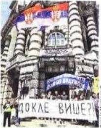
Протест након последњег напада на просветне раднике

– Не постоје „мали избори“. Не постоје мање или веће важни избори. Сваки су избори битни. И сваки избори су својеврсни референдум о питању да ли жељимо Србију која ће се развијати у складу с нашим планом „Скоп у будућности 2027“ или Србију која неће поштеновати себе и своје интересе – додаје Милош Вучевић. стр. 8