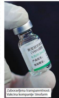
Zaboravljena transparentnost: Vakcina kompanije Sinofarm

Ekonomista Milan Kovačević, stručnjak za strana ulaganja, pita se zašto su u dogovor uključeni