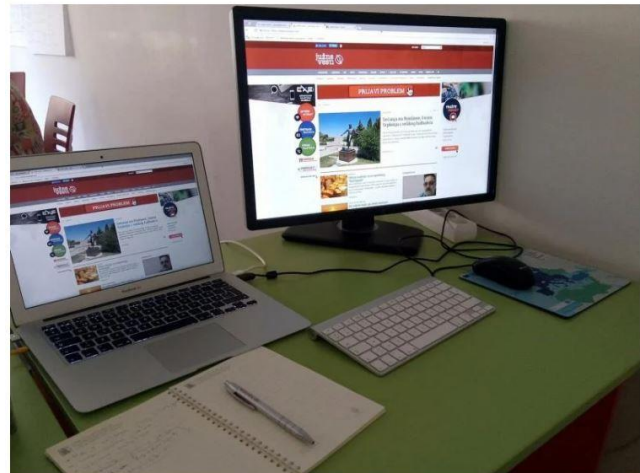
U poslovanju JV sve je bilo čisto, foto: JV