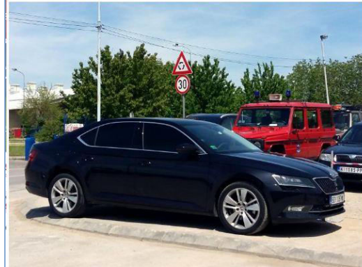
Jedna od ustupljenih "škodi superb".

Uprkos merama štednje Vlade Srbije i racionalizaciji voznog parka iz 2015, Ministarstvo za rad, zapošljavanje, boračka i socijalna pitanja sve to vreme pribavlja nova luksuzna kola tako što ih ustanove socijalne zaštite na spornim tenderima kupuju za njih, pokazuje istraživanje Južnih vesti.