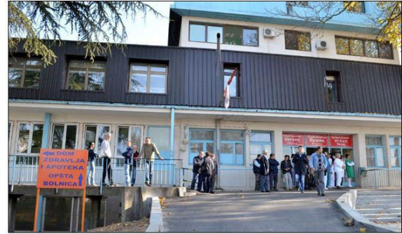
Počele kontrole bolnica / Višac

Preporučeno | Podeli | 168 | Tweet | G+ | 0