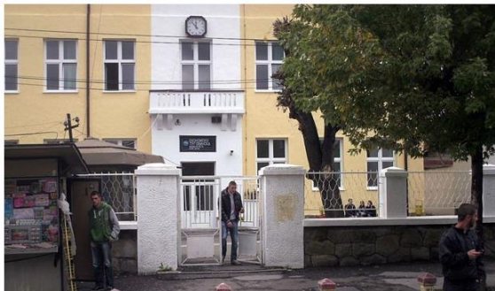
U toku je konkurs za novog direktora Ekonomsko-trgovačke škole u Novom Pazaru