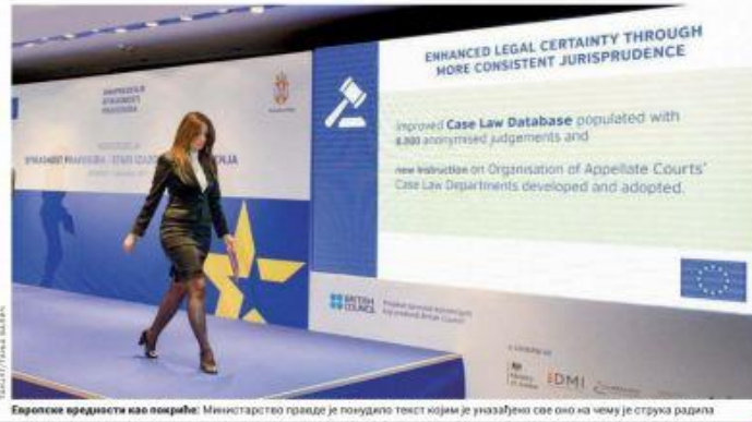
Европске вредности као покриве: Министарство правде је понуђило текст којим је уназађено све оно на чему је струка радила