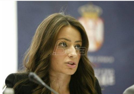
Ministarka pravde Nela Kuburović rekla je u Kragujevcu da je novi Zakon o borbi protiv korupcije radjen u potpunosti u skladu sa preporukama Greka, tela Saveta Evrope koje se bavi borbom protiv korupcije, demantujući ocene nevladine organizacije Transparentnost Srbija.