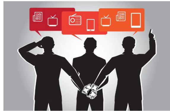
U gotovo trećini opština u pokrajini predstavnici Asocijacije elektronskih medija Vojvodine (AEMV) u lokalnim komisijama dodeljivali su budžetski novac jedni drugima Novinar: Denis Kolundžija

Fantomska medijska organizacija puštoši medijske konkurse – u lokalnim komisijama budžetski novac dodeljivali jedni drugima