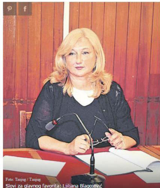
Slovi za glavnog favorita: Ljiljana Blagojević

Agencija za borbu protiv korupcije ponovo bira direktora, a među kandidatima su i nekadašnji političari i njihovi bliski saradnici.