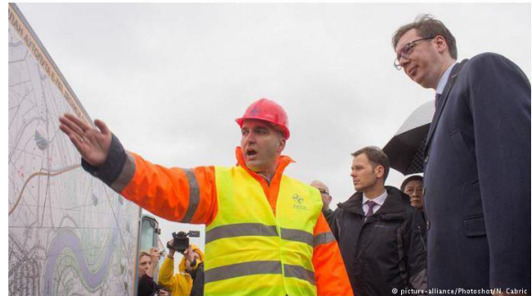
Vreme kampanje je pomalo vreme čuda. Tada niču škole, umivaju se bolnice, grade se fabrike i, više od

Premijer koji planira da postane predsednik marljivo preseca svečane vrpce od Indije do Indije. Tako nastavlja rđavu praksu zloupotrebe funkcije u kampanji. Nijednoj vlasti nije padalo na pamet da promeni zakone.