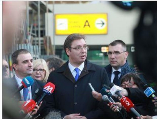
Вучић је, у обраћању новинарима, истакао да укупна вредност радова

Београд, 9. децембар 2016. године – Председник Владе Републике Србије Александар Вучић обишао је данас новоизграђену платформу за одлеђивање и спречавање залеђивања авиона на Аеродрому "Никола Тесла" у Београду, нагласивши том приликом да тај аеродром у свим сегментима бележи рекорде у региону.